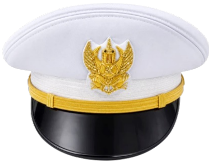
หมวกเครื่องแบบปกติขาว ชาย

แบบที่ ๒ หมวกแก๊ปทรงอ่อนพับปีกสีขาว สายรัดคางสีทอง กว้าง ๑ เซนติเมตร มีดุมโลหะสีทองตราครุฑพ่าห์ขนาดเล็กติดที่ข้างหมวกข้างละ ๑ ดุม ผ้าพื้นหมวกสีขาว ที่หน้าหมวกติดตราครุฑพ่าห์ปักดินสีทองสูง ๔.๕ เซนติเมตร บนหมอนสักหลาดสีขาว (ตามภาพตัวอย่าง)