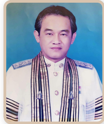
นายเอนก หุตังคบดี ประธานสภากรุงเทพมหานคร คนที่ ๑๒ วาระการดำรงตำแหน่ง ๒๖ พฤษภาคม ๒๕๔๒ - ๓ พฤษภาคม ๒๕๔๓