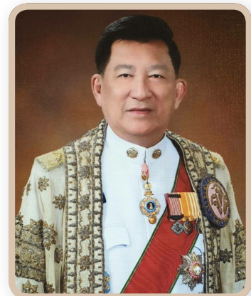
ร้อยตำรวจตรี เกรียงศักดิ์ โลหะชาละ ประธานสภากรุงเทพมหานคร คนที่ ๒๐ วาระการดำรงตำแหน่ง ๒๔ กันยายน ๒๕๕๗ - ๖ กุมภาพันธ์ ๒๕๖๓