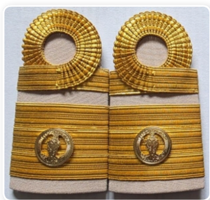
อินทรรูปแข็ง

๒. อินทรรูปแข็ง ใช้กับเสื้อเครื่องแบบปกติขาว ชายหญิงใช้เหมือนกัน ขนาดกว้าง ๔ เซนติเมตร ยาวตามความยาวของป่า พื้นสักหลาดสีดำ ด้านคอปलयมนติดดุมโลหะสีทองตราครุฑพ่าห์ขนาดเล็กปักดินสีทอง เป็นลายประจำยามก้ามปูเต็มแผ่นอินทรรูป (ตามภาพตัวอย่าง)