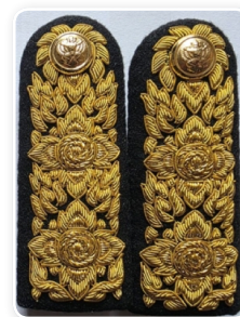
อินทรรูปอ่อน