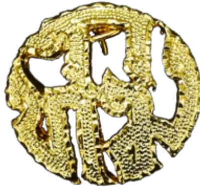
เข็มอักษรย่อ “กทม.”

๓. เข็มอักษรย่อ “กทม.” ทำด้วยโลหะสีทอง ใช้ติดที่อกเสื้อเครื่องแบบเหนือกระเป๋าบนด้านขวา (ตามภาพตัวอย่าง)