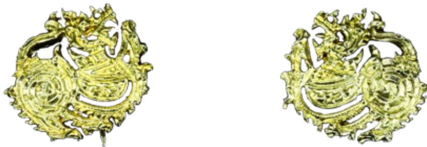
เครื่องหมายรูปตราราชสีห์

๔. เครื่องหมายรูปตราราชสีห์ ให้ติดที่ปกคอเสื้อด้านหน้าทั้งสองข้าง สำหรับสมาชิกสภาหญิงให้ติดที่ปกคอแบะของเสื้อตอนบนทั้งสองข้างเหนือแนวเครื่องราชอิสริยาภรณ์ (ตามภาพตัวอย่าง)