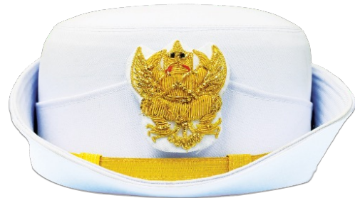
หมวกเครื่องแบบปกติขาว หญิง