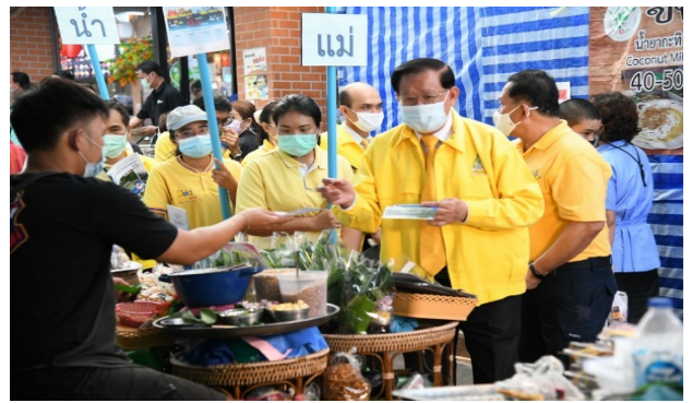
วันอังคารที่ ๘ ธันวาคม ๒๕๖๓ ลงพื้นที่คลองหลอดวัดเทพธิดาราม